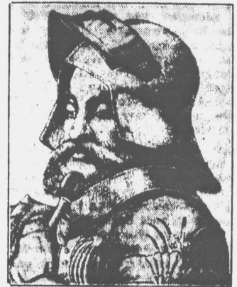
378ste STERFDAG VAN GOETZ VON BERLICHINGEN

De vijf verhalen, in dit boek samengevoegd, verrassen meer door hun curieus zich ontwikkelend verloop dan door een penetrante psychologie; zij zijn klaar, rustig van voordracht, maar de analyse, die steeds duidelijk de pretentie heeft uiterst scherpzinnig te zijn, is gemeenlijk het tegendeel van clairvoyant. De Bourbons werk wisselde — in de afgelopen jaren — wel van accent en thema, maar thema en accent verdiepten zich niet noemenswaard. 'n Enkel detail is plotseling verrassend scherp; plotseling treft een fijne (of navrante) notitie, maar gemeenlijk spelevaart hij slechts aan de oppervlakte zijner „diepzinnige” problematiek. Hij verstaat uitstekend de kunst vlot, eenigszins overrompelend, te ensceneeren; hij wekt voortdurend de suggestie de domeinen van het uitzonderlijke en zeer bijzondere te bewonen, maar het psychisch gebeuren daaronder verloopt maar poover en vaak banaal. Hij spreekt (maar hoeveel schraler) voortdurend met de stem van een ander: van Rilke, Gilliams, van Marsman soms; hij spreekt over thema's,