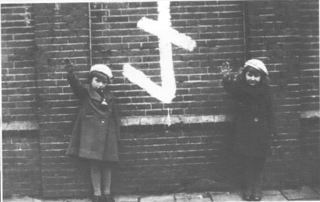
Twee kinderen van NSB'ers brengen de Hitlergroet bij een op de muur geschilderde wolfsangel. Dit teken was een herkenningsteken voor onder andere de SS, de Nederlandse Landstorm, de NSB en de Nederlandse Arbeidersdienst.