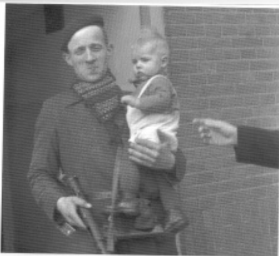
Bij de arrestatie van hun ouders werden de kinderen van NSB'ers vlak na de bevrijding door de Binnenlandse Strijdkrachten uit huis gehaald.

gedragen, maar dat kan alleen op voorwaarde dat de taal en informatie die het tot zijn beschikking heeft kloppen en een authentieke beschrijving vormen van wat relevant is in zijn of haar leven. De waarheid mag nog zo onwelgevallig zijn, deze is altijd beter dan de onzekerheid niet te weten in welke positie men zich bevindt en hoe het leven aan te pakken.