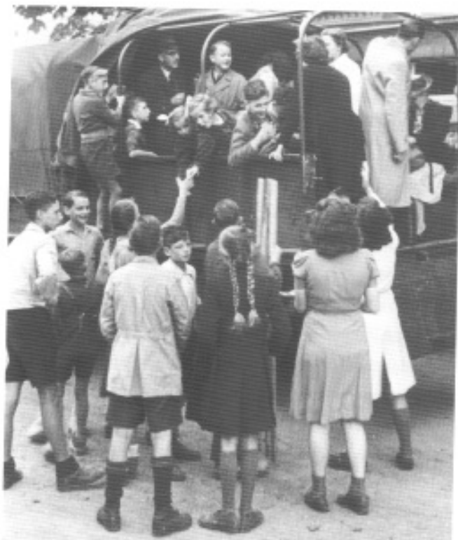
Kinderen van NSB-ers werden na de oorlog overal in Nederland in tehuizen ondergebracht, onder meer in Huize St. Pieter in Maastricht.

De ouders die gecollaboreerd hadden, praatten over het algemeen juist niet met hun kinderen over hun leven en hun blik op de wereld. Ze lieten, uit schaamte of uit onkunde, de kinderen in het duister omtrent hun eigen verleden. Daardoor bleef de werkelijkheid ongrijp-